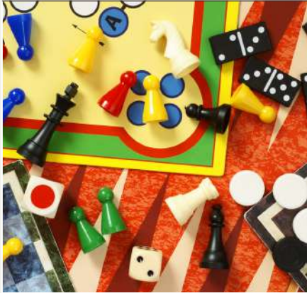
JUEGOS DE MESA